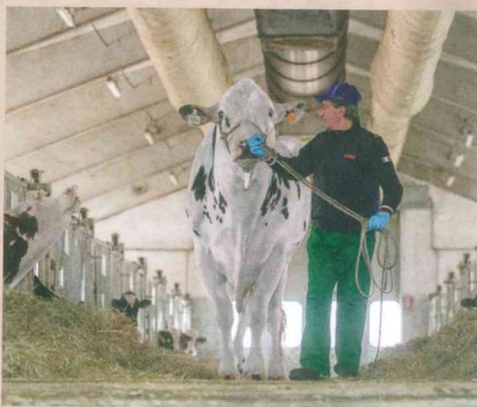
Il toro Sound System nelle stalle del Centro Insieme di fecondazione artificiale a Modena.